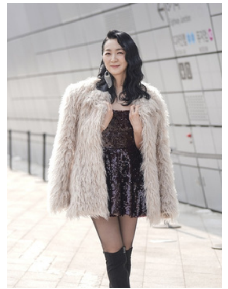
LA STAR INTERNATIONALE KIM JOO-RYOUNG (1,8 M FOLLOWERS SUR INSTAGRAM)

Du 3 au 12 juin 2026, le Printemps Asiatique Paris mettra à l'honneur la Corée à l'occasion de sa 9 e édition. L'événement