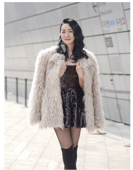
LA STAR INTERNATIONALE KIM JOO-RYOUNG (1,8 M FOLLOWERS SUR INSTAGRAM)

Du 3 au 12 juin 2026, le Printemps Asiatique Paris mettra à l'honneur la Corée à l'occasion de sa 9 e édition. En huit ans, l'événement s'est imposé comme l'un des rendez-vous internationaux majeurs du marché des arts asiatiques, réunissant galeries, maisons de ventes et institutions autour d'une programmation concertée mêlant expositions, ventes, visites et conférences.