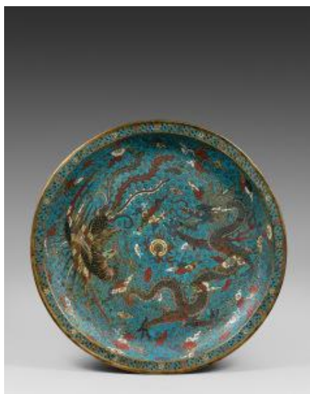
Plat en émaux cloisonnés à décor de dragon et phénix, Chine, Dynastie Ming, fin 16e siècle, Dia. 42,5 cm.