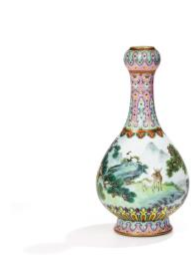
Vase Yangcai "Famille Rose", porcelaine, règne de l'empereur Qianlong (r. 1736-1795)

La semaine sera également rythmée par les différentes ventes aux enchères ayant lieu à l'hôtel Drouot et dans les maisons de ventes du quartier Matignon.