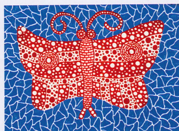
↳ Yayoi Kusama, Butterfly , 1990.

Depuis que la Knokke Art Fair a trouvé sa place au Grand Casino et qu'Alexander Tutelaers y a opéré des choix visionnaires, le salon écrit une nouvelle narration. Aujourd'hui, le design, l'art moderne et l'art contemporain occupent une place centrale, qui s'adressent au collectionneur osant acquérir des artistes inconnus pour les retrouver des années plus tard dans de grandes collections et expositions. HIGHLIGHTS.be n'est pas seulement l'attraction centrale de la foire, elle manifeste le niveau et le potentiel des collections belges. Cette année, elle regroupe dix sculptures emblématiques d'artistes comme Berlinde De Bruyckere, Anthony Caro, Antony Gormley, William Kentridge et Bruce Nauman, toutes issues de collections flamandes. Si elles ne sont pas à vendre, ou pourra en revanche acquérir, en un seul bloc, la Collection Yayoi Kusama (de 1980 à nos jours) que l'enseigne Von Vertes a constituée au fil des ans. La seule foire européenne organisée au cœur de l'été se déroule du 05 au 15-08. Parmi les participants internationaux, citons Rueb, la Galerie Dix9, Von Vertes et Pot & Berden. www.knaf.be