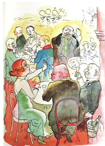
↳ George Grosz, exposé chez Erik Tonen Books (Anvers), au Salon du Mont des Arts.

Le Festival de l'histoire de l'art, qui tient sa 12 e édition du 02 au 04-06 au château de Fontainebleau, a choisi la Belgique comme pays invité et le climat comme thématique à explorer. Le paysagiste Bas Smets (qui doit notamment repenser le parvis de Notre-Dame) tient ainsi la conférence inaugurale, tandis que la chorégraphe Anne Teresa de Keersmaecker investit les espaces du château avec une performance sur mesure, inspirée des écrits de George Sand pour la défense de la forêt de Fontainebleau. www.festivaldelhistoiredelart.fr ■ A Paris, du 07 au 16-06, devant l'engouement pour les arts asiatiques qui ne cesse de croître, se tient la 6 e édition du Printemps Asiatique. Musées, institutions culturelles, maisons de ventes et galeries se regroupent pour l'occasion