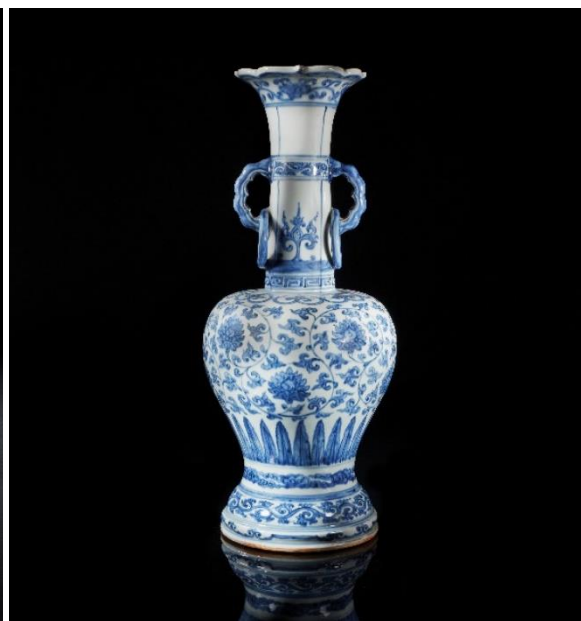
Vase balustre en porcelaine bleu blanc, Chine, époque Zhengde (1506-1521) Vendu 755 200 € par Tessier & Sarrou et associés - Drouot