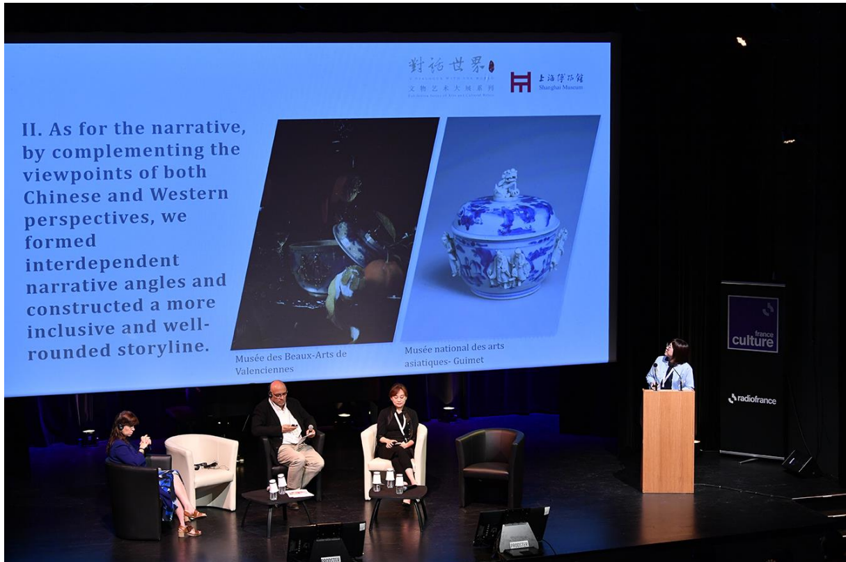
Colloque International : Exposer les ArtsAsiatiques, nouvelles perspectives franco-chinoises Musée Guimet - Samedi 8 juin 2024

Le programme comptait également des ateliers d'expertise, projection et concert.