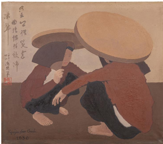
Nguyễn Phan Chánh (1892-1984), Les Chanteuses de Campagne , 1930 - Huile sur toile Vendue 1 020 000 € chez Sotheby's

La vente proposée par Sotheby's a atteint plus de 6 millions d'euros. Parmi les plus hautes adjudications, Les Chanteuses de Campagne , une huile sur toile peinte par Nguyễn Phan Chánh (1892-1984) en 1930, provenant d'une collection française, s'est envolée à 1,02 millions d'euros.