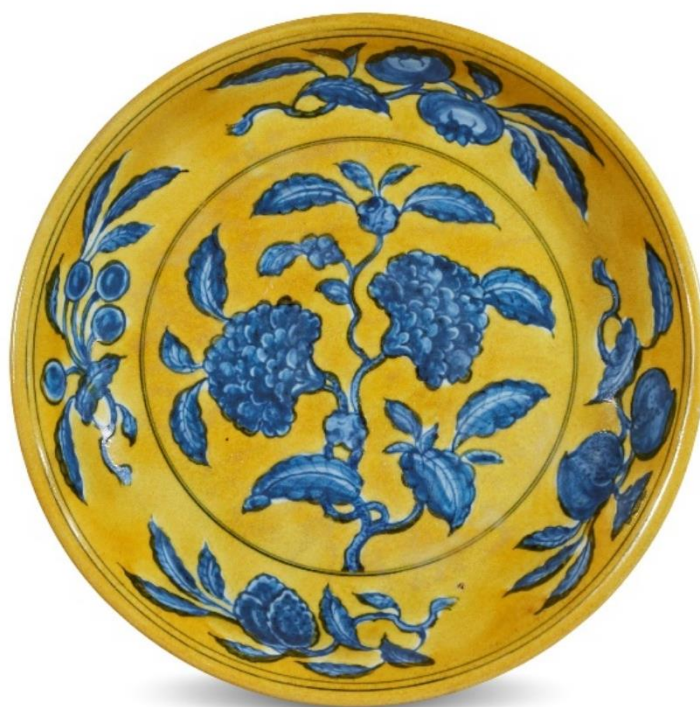
Coupe en porcelaine bleu blanc à fond jaune à décor de fleurs de grenadiers. Chine, dynastie Ming, marque à six caractères dans double cercle en bleu sous couverte et époque Zhengde (1506-1521) - Vendue 315 000 € chez Christie's Paris