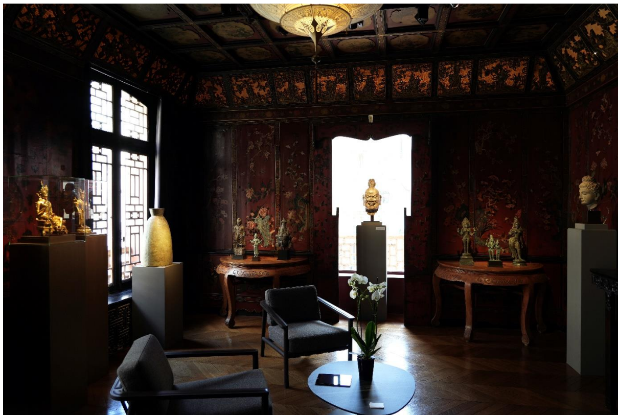
La Pagode

Depuis 2022, le Printemps Asiatique ouvre à ses visiteurs les portes habituellement closes de la Pagode, située dans le 8 e arrondissement parisien et ancienne demeure du célèbre marchand Ching Tsai Loo (1880-1957). Cette année, pour la première fois, la manifestation occupait les quatre étages du mythique bâtiment - deux étages étaient occupés les années précédentes - afin d'accueillir une exposition collégiale réunissant galeries ou marchands français et internationaux. Parmi les participants venus de l'étranger, Carlton Rochell Asian Art s'était déplacé de New-York tandis que Gregg Baker, Nies Oriental Art et Carlo Cristi Asian Arts Company venaient de Belgique et Ollemans Oriental Art ou encore Runjeet Singh de Grande-Bretagne.