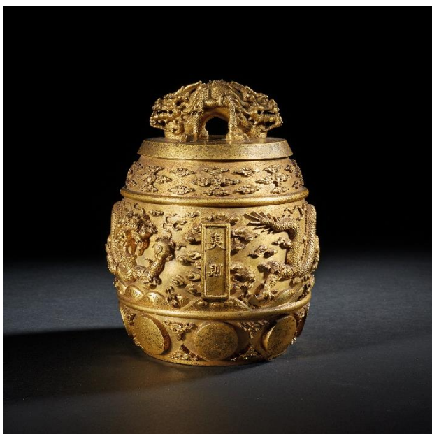
Cloche rituelle bianzhong en bronze doré, Chine, dynastie Qing, époque Kangxi (1662-1722) - Provenance : collection Semallé Vendue 512 000 € par Tessier & Sarrou et associés - Drouot